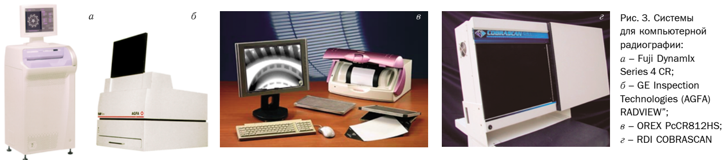
Рис. 3. Системы для компьютерной радиографии: а – Fuji Dynamix Series 4 CR; б – GE Inspection Technologies (AGFA) RADVIEW™; в – OREX PcCR812HS; з – RDI COBRASCAN

ле с использованием программ поиска дефектов, делается заключение и производится распечатка протокола контроля.